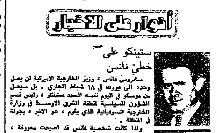
السفير الأميركي الجديد في لبنان السيد جورج لين ، استقبل امس وزير الخارجية والمغتربين السيد فؤاد بطرس.

استقبل امس السيد فؤاد بطرس وزير الخارجية والمغتربين السيد جورج لين ، السفير الأميركي الجديد في لبنان السيد ريتشارد باركر برافته التمام بأعمال السفارة الخارجية والسفير الأميركي في بيروت.